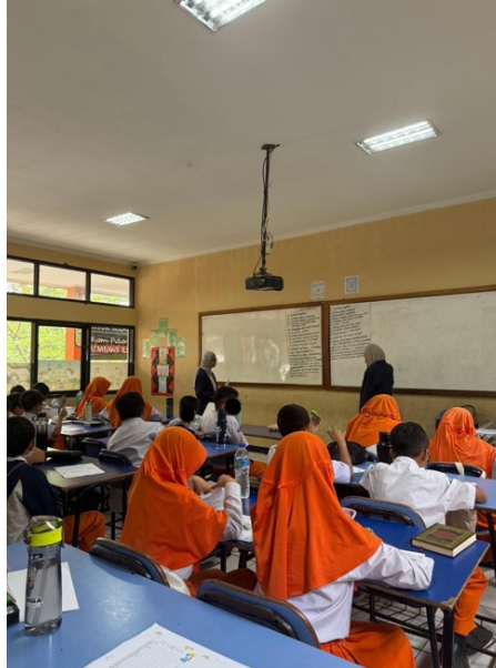
Gambar 4. Pengisian GRAT-Short Form posttest

Pada tahap pelaksanaan kegiatan, intervensi berlangsung selama lima hari. Setiap sesi dilakukan secara langsung di ruang kelas dengan urutan kegiatan yang sistematis, meliputi pembukaan, pengarahan, dan dilanjutkan dengan pengisian Thank You Letters Card oleh siswa. Setelah pengisian Thank You Letters Card , siswa diminta untuk memberikan umpan balik mengenai kesan mereka terhadap kegiatan yang telah mereka lakukan. Sebagai tambahan, pada sesi pertama (hari senin) dilaksanakan pre-test , sesi keempat (hari kamis) dilaksanakan post-test dan sesi kelima (setelah 12 hari) dilaksanakan follow up .