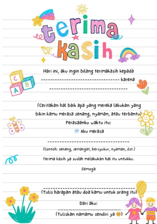
Gambar 1. Thank You Letter Card

Pada tahap persiapan, tim terlebih dahulu dengan mengajukan izin administratif resmi dari Kepala Sekolah SD Al-Ma'soem Bandung. Perlindungan terhadap privasi partisipan dipastikan melalui penyamaran identitas menggunakan kode anonim pada seluruh lembar kerja dan kuesioner. Selanjutnya tim peneliti menyusun modul intervensi berbasis modifikasi dari intervensi [14] yang telah digunakan pada penelitian sebelumnya. Salah satu fokus utama pada tahap ini adalah mengembangkan media berupa Thank You Letters Card (Gambar 1). Pada intervensi ini, lembar kerja cetak dirancang untuk menggantikan penggunaan Google Form sebagaimana yang dilakukan penelitian [14] pada penelitian sebelumnya.