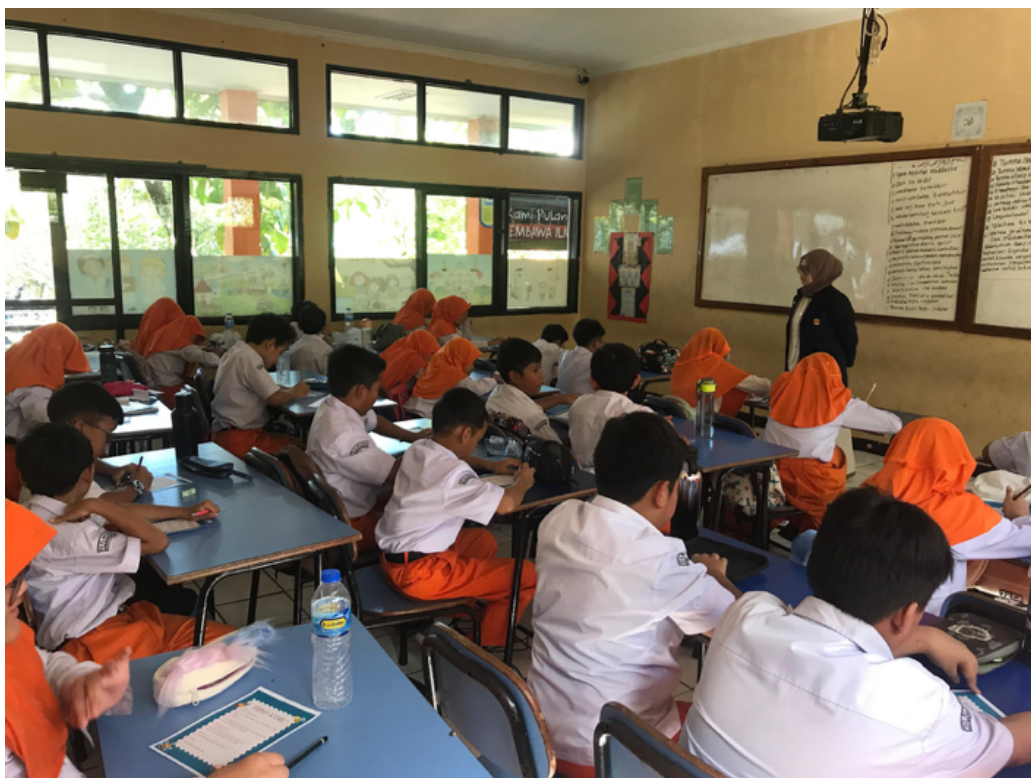
Gambar 3. Siswa mengikuti kegiatan intervensi

Partisipan dalam penelitian ini adalah siswa SD kelas 4 yang terdiri dari 44 siswa (18 laki-laki dan 26 perempuan). Setiap sesi dilakukan secara langsung di ruang kelas dengan urutan kegiatan yang sistematis, meliputi pembukaan, pengarahan, dan dilanjut dengan pengisian Thank You Letters oleh siswa.