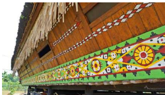
Gambar 2. Ornamen Pangeret-eret