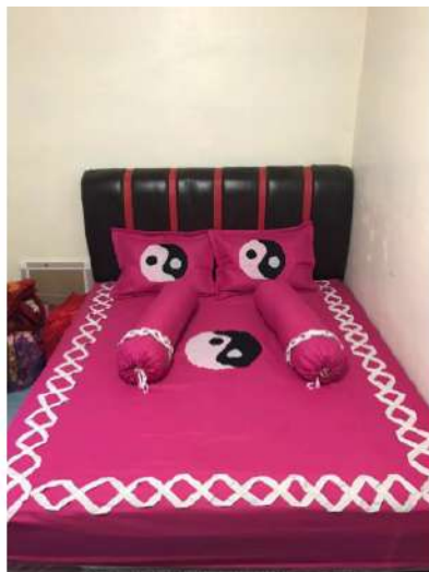
Gambar 4. Kerajinan bed cover

Gambar 1 simbol Ying Yang yang merupakan simbol religi dari masyarakat China yang mengingatkan para umat agar tetap menjaga keseimbangan antara kedua unsur. Ornamen ini mempunyai makna yang menggambarkan sisi gelap dan sisi terang yang mewakili prinsip kekuatan di alam. Ornamen Ying Yang pada dasarnya adalah dua kekuatan yang saling melengkapi berinteraksi dalam sistem dinamik yang secara keseluruhan lebih besar daripada apabila masing-masing terpisah. Taijitu yang dalam terjemahan bebasnya berarti “diagram kekuatan agung yang merupakan simbol dari konsep Ying Yang. Area hitam melambangkan Ying dan area putih melambangkan Yang. Pada masing-masing area terdapat titik besar dengan warna yang berkebalikan (titik hitam pada area putih, titik putih pada area hitam) yang menggambarkan bagaimana masing-masing elemen akan berubah menjadi elemen lainnya.