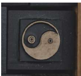
Gambar 1. Ornamen Ying Yang