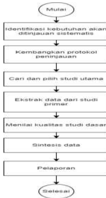
Gambar 1. Metode Penelitian

Seperti yang ditunjukkan pada gambar 1, dalam literature riview terdapat tiga tahap didalamnya, diantaranya adalah: merencanakan, melaksanakan dan pelaporan. Pada (langkah 1) akan dilakukan identifikasi kebutuhan yang ditinjau secara sistematis yang ada mengenai beberapa metode, selanjutnya akan di kembangkan sebuah protokol pencarian tinjauan, agar penelitian yang dilakukan tidak keluar dari tujuan penelitian. (tahap 2) selanjutnya akan dicari dan dipilih berbagai artikel dari web jurnal yang sudah terindeks sinta dan scopus, setelah didapatkan artikel dengan jumlah yang diinginkan, artikel tersebut akan di pilah berdasarkan rentang inklusi dan eksklusi. Pada (langkah 3) akan dibuat sebuah rangkuman penelitian dalam bentuk laporan penelitian.